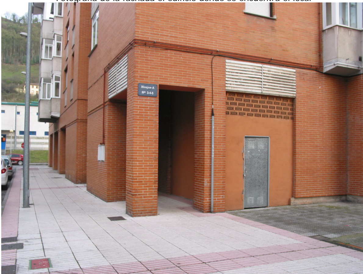
Puerta del local en la fachada derecha