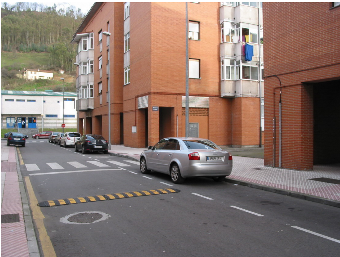
Fotografía de la fachada el edificio donde se encuentra el local